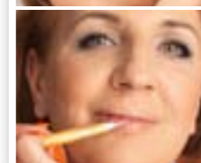
KOREKTOR ROZŚWIETLAJĄCY zatuszował cienie pod oczami i ukrył drobne przebarwienia.