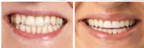
Idealny uśmiech Ewy to zasługa świetnych specjalistów oraz najnowocześniejszego sprzętu i materiałów w Villa Nova Dental Clinic.