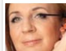
KREATOR BRWI I RZĘS pozwala podkreślić i zdyscyplinować brwi.